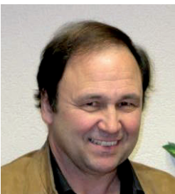
Par Claude Languetin, Syndic