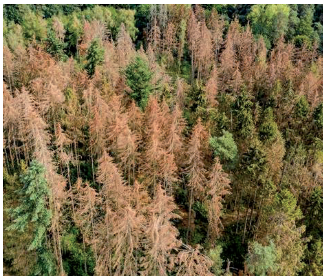
Foyer de bostryches à un stade avancé.

Chaque année nous laisse son lot de surprises. En effet, après une fin d'année chaude et sèche en 2022, les arbres dépérissent aujourd'hui à vue d'œil... Bostryche typographe, chalcographe, scolyte curvidenté, pissode du sapin blanc, tant de noms atroces pour parler de parasites plus petits qu'un demi-centimètre qui ont profité de l'affaiblissement des arbres pour pulluler. Souvenez-vous de l'été passé, les arbres avaient fait tomber leurs feuilles afin d'éviter de se dessécher (oui les arbres transpirent par les feuilles ou les aiguilles). Une technique de survie qu'on ne voit que très rarement dans notre région mais qui explique une fatigue importante des arbres et qui les rendent moins résistant aux ravageurs.