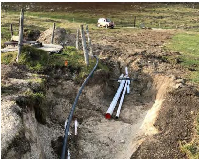
Le puits à gauche d'où viendra l'eau et les nombreux tubes posés.

Les travaux reprennent à la mi-avril 2021. Le câble d'alimentation électrique est tiré le 22 avril, le 23 avril les 2 chalets sont raccordés au réseau électrique et les installations électriques intérieures sont posées par l'entreprise Télectric. Suivront rapidement les derniers remblayages de fouilles, création de chambres de visite pour le réseau d'eau, appareillage complet des conduites (raccords, vannes, divers clapets et flotteurs, etc), pose du revêtement bitumeux aux passages de routes vers le bovi-stop et devant le chalet de la Sagnette. La pompe immergée dans le puits est installée durant la première semaine de mai et la mise en route s'effectue le 11, de nombreuses sécurités garantissent le fonctionnement de la pompe. Suivront les tests de redistribution de l'eau depuis la citerne du point haut vers les différents bassins et tout semble fonctionner comme prévu. Merveilleux, car avec les conduites d'eau les surprises sont souvent présentes ! Beau développement des infrastructures pour ces 2 alpages !