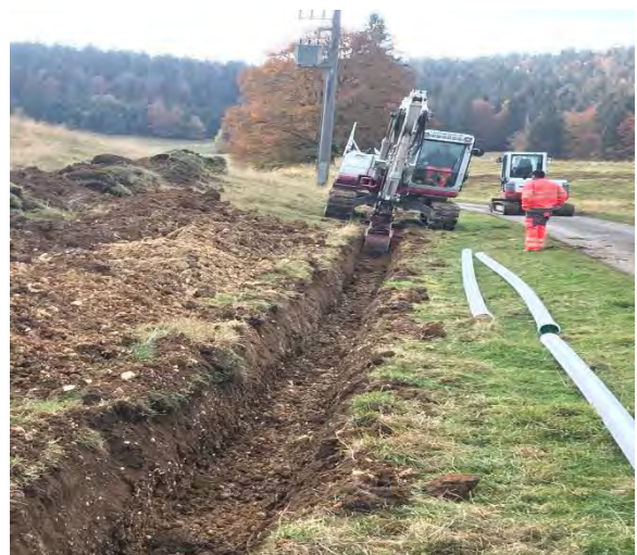
La creuse en direction du transformateur électrique de la Posogne.